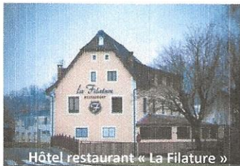
Hôtel restaurant « La Filature »