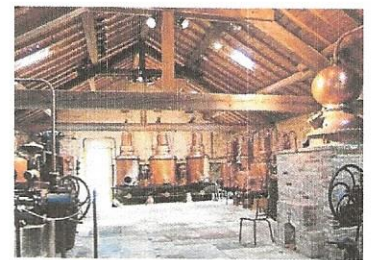
Ecomusée de la cerise