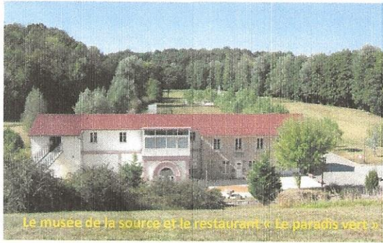
Le musée de la source et le restaurant « Le paradis vert »